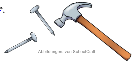
Abbildungen: von SchoolCraft

Hier kann ich besonders gut nachdenken hier .